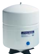
ЕМКОСТЬ ДЛЯ ХРАНЕНИЯ 19 l