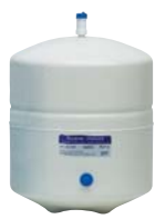
Емкость 19 л