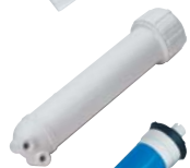
КОРПУС ДЛЯ ОСМОТИЧЕСКОЙ МЕМБРАНЫ ЭКСКЛЮЗИВНЫЙ ДИЗАЙН ATLAS FILTRI С ДВОЙНЫМ УПЛОТНЕНИЕМ