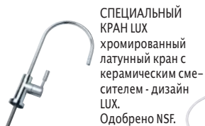
СПЕЦИАЛЬНЫЙ КРАН LUX хромированный латунный кран с керамическим смесителем - дизайн LUX. Одобрено NSF.