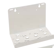
МЕТАЛЛИЧЕСКИЙ СТЕНОВОЙ КРЕПЁЖНЫЙ ЭЛЕМЕНТ DUO PUMP В КОМПЛЕКТЕ С ШУРУПАМИ