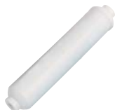
УГОЛЬНЫЙ ПОСТФИЛЬТР IN-LINE 2x10" ЭКСКЛЮЗИВНЫЙ ДИЗАЙН ATLAS FILTRI